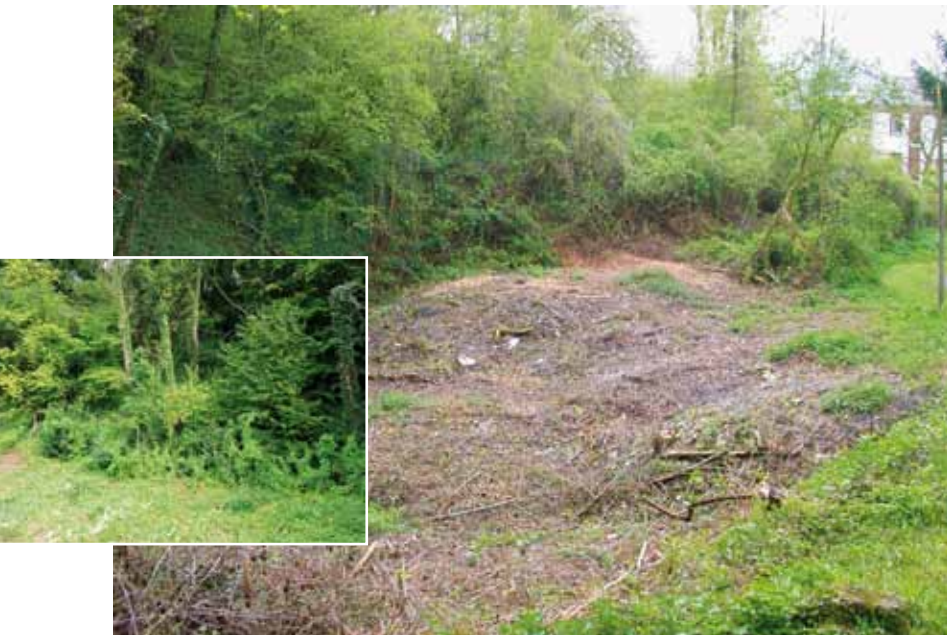
Abb. 3: Zustand des Projektgeländes im Jahr 2008. Die Einblendung zeigt die stark bewachsene Steilwand auf der rückwärtigen Seite des Geländes.

sehen sind, da der Wald derzeit nur wenig besonnte, feuchte Lichtungen und damit Trittsteinhabitats bietet. In allen Fällen wären eine Ausweitung des Offenlandhabitates und eine Zunahme der Anzahl der Gewässer wünschenswert. Das südlichste Vorkommen der Gelbbauchunke im Stadtgebiet von Bonn befindet sich auf einem privaten Grundstück