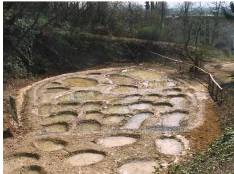
Abb. 12: 16.03.2011: Gewässer in nahezu gefülltem Zustand und letzte Arbeiten am Gelände.

der Erosion an der künstlichen Böschung vorzubeugen, wurde diese mit 5 t Basaltschotter befestigt. Außerdem wurde eine regelbare Überleitung für das Brunnenwasser geschaffen.