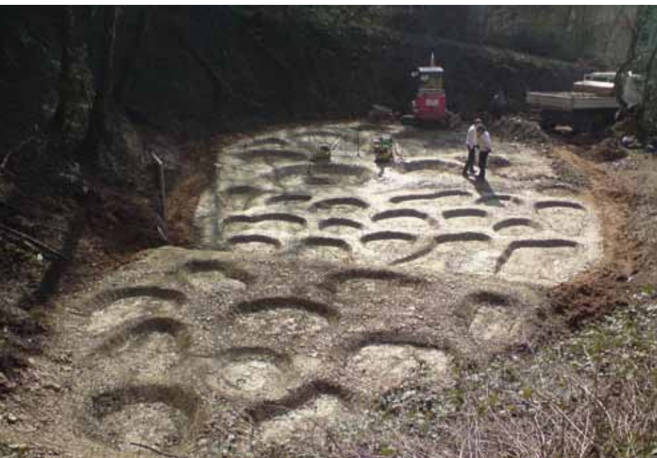
Abb. 10: 12.03.2011: Ausformen der einzelnen Gewässer.

merk auf die Anlage von 34 besonnten Kleinstgewässern speziell für die Gelbbauchunke gerichtet.