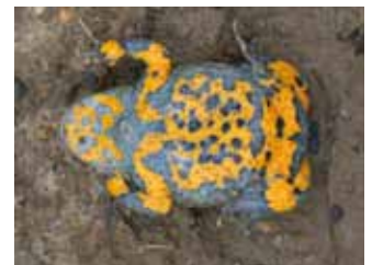
Abb. 1: Namensgebende Bauchseite der Gelbbauchunke.

Die Situation in Bonn In Bonn kommt die Gelbbauchunke derzeit an sechs Stellen im Waldbereich des Siebengebirges vor, die zu fünf Vorkommen zusammengefasst werden können. Alle Vorkommen sind auf kleinflächige Offenlandbereiche beschränkt, die als weitgehend isoliert anzusehen.