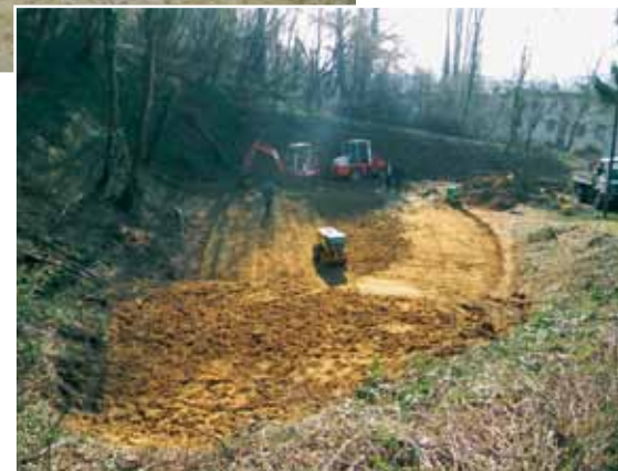
Abb. 8: 04.03.2011: Nahezu fertige Abdichtung.