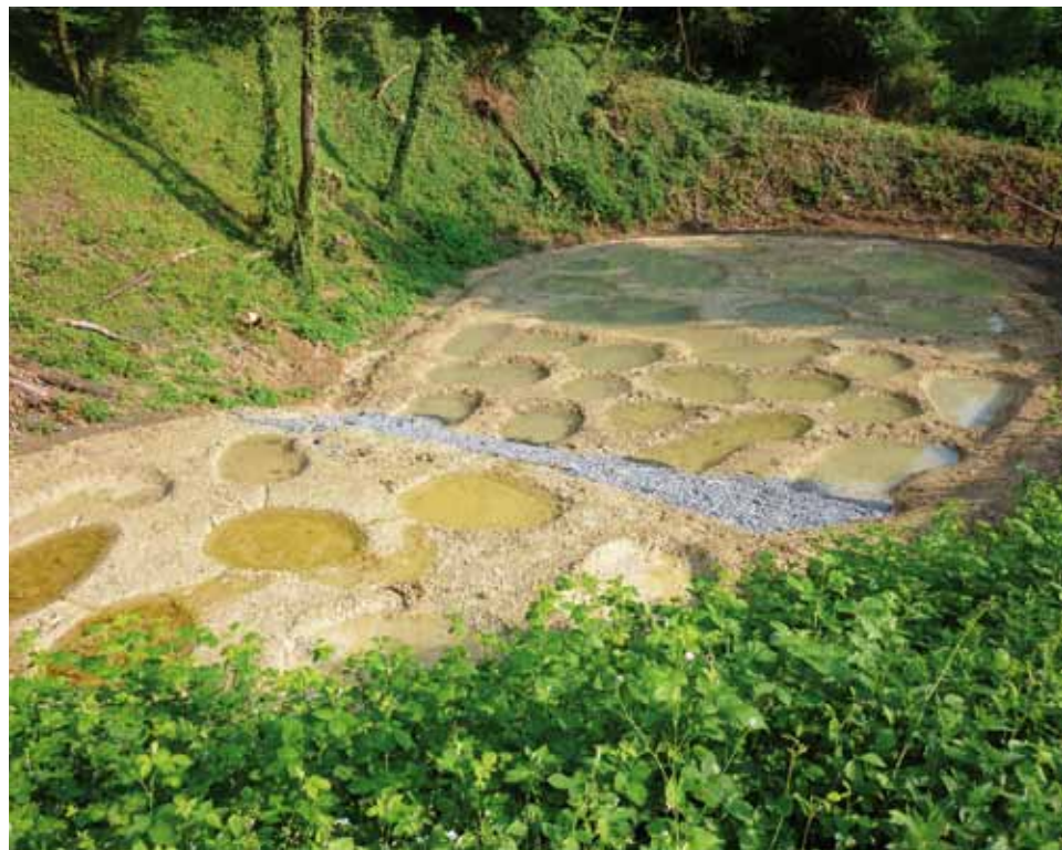
Abb. 13: 28.04.2011: Mehrere Unken halten sich in den Gewässern auf.

Die Gewässer haben trotz anhaltender Trockenheit ihren Wasserstand nahezu gehalten, die Abdichtung funktioniert also sehr gut. Mehrere Gelbbauchunken wurden bereits in den Gewässern gesichtet, sodass mit einer zügigen Annahme des neuen Lebensraumes gerechnet werden kann. In der nächsten „elaphe“ geben wir einen aktuellen Überblick über dieses von der DGHT geförderte Projekt. ☐☐