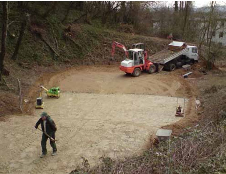
Abb. 9: 10.03.2011: Einbringen der 10 cm dicken Abdeckschicht.