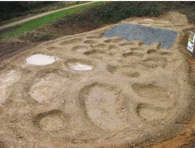
Abb. 11: 15.03.2011: Befestigte Böschung und Testbefüllung einzelner Gewässer.