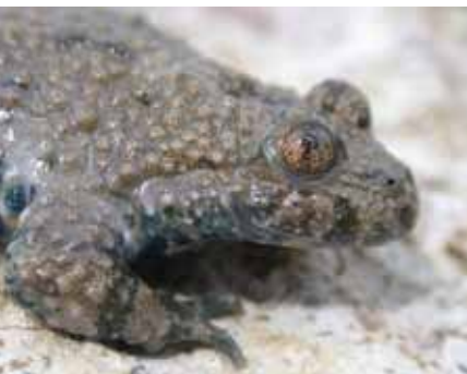
Abb. 4: Porträt der Gelbbauchunke.

sehen sind, da der Wald derzeit nur wenig besonnte, feuchte Lichtungen und damit Trittsteinhabitats bietet. In allen Fällen wären eine Ausweitung des Offenlandhabitates und eine Zunahme der Anzahl der Gewässer wünschenswert. Das südlichste Vorkommen der Gelbbauchunke im Stadtgebiet von Bonn befindet sich auf einem privaten Grundstück