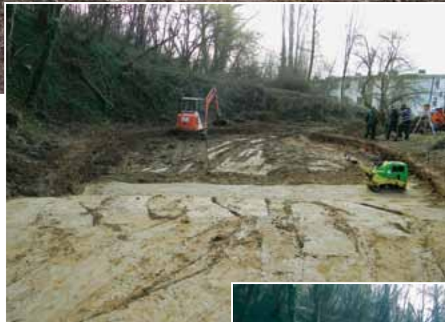
Abb. 7: 01.03.2011: Einbringen des Dichtmaterials (Dernoton) auf die verdichtete Kies-schicht.