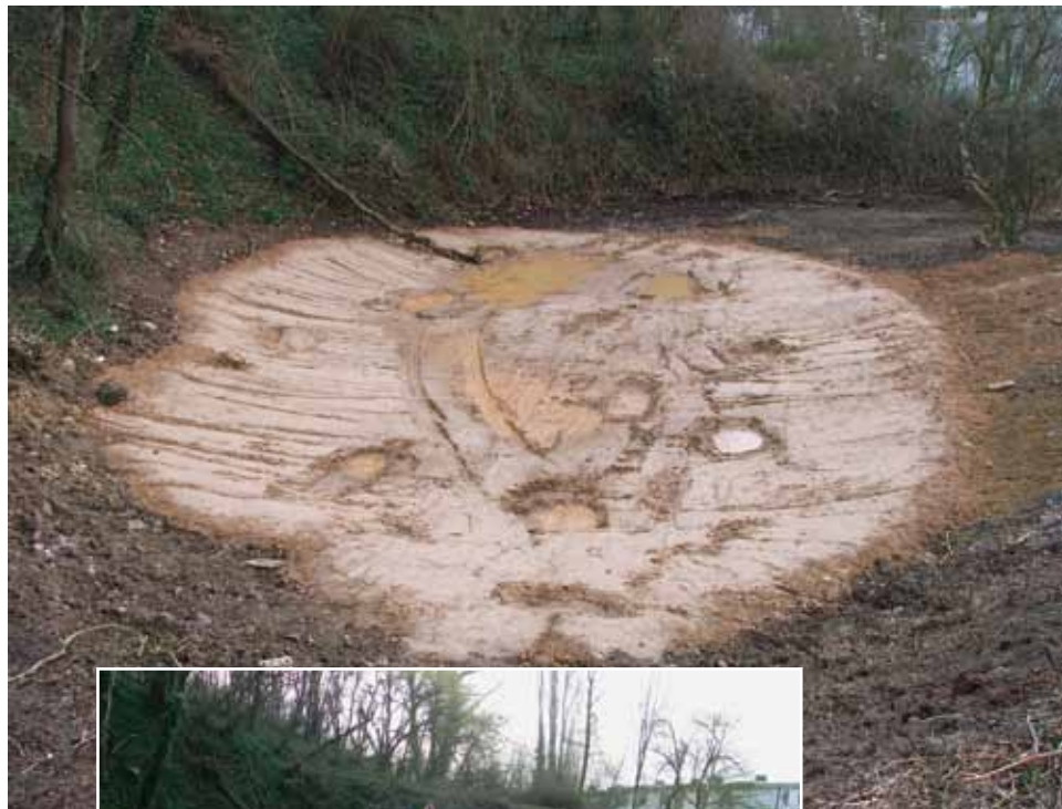
Abb. 6: Zustand 2011 vor der Maßnahme.

Bericht über die durchgeführten Maßnahmen Ziel der aktuellen Maßnahme war die Optimierung der von der Stadt Bonn begonnenen Arbeiten und damit die Schaffung eines großen Angebotes an geeigneten Laichgewässern sowie die Entfernung von Schatten werfenden Gehölzen. Hierbei wurde das Hauptaugen-